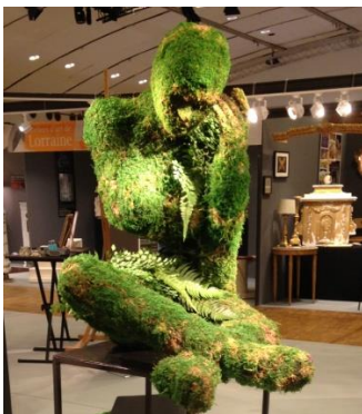
2015 : La songeuse des sous bois. Sculpture végétale en stabilisé (mousses, fougères). Création pour le salon du patrimoine culturel (Paris – Carrousel du Louvre)