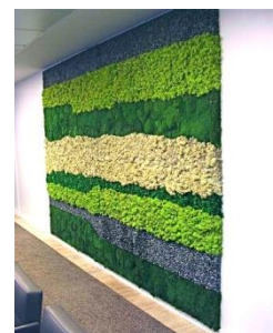
2008 : Fresque végétale en stabilisé (mousses, lichens, galets). Longueur 3,5 m., hauteur 2,5 m. Siège d'Hammerson à Paris

Dans le même temps, la vocation artistique de Geneviève Mathieu l'amènera à proposer des créations originales sous forme de fresques végétales avec le désir de faire revenir des pans de nature dans la réalité urbaine, mais toujours avec le souci de respecter l'harmonie initiale des lieux, la géométrie structurée et un peu froide des bureaux et salles de conférence. Un grain de fantaisie qui permet, peut-être, aux esprits de prendre quelques instants de recul propices à une respiration dans le bouillonnement des réunions.