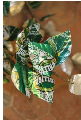
Recycl'Arbre 1. Présenté lors de la biennale OKSEBO 2017 au Château de La Roche-Guyon.

Une nouvelle version va voir le jour en 2018, pour l'exposition « Les Arborés » organisée à Corbeil-Essonnes. Avec toujours un cadre de prestige. Cette fois, c'est la Commanderie Saint Jean, une chapelle et un prieuré du 13 ème siècle construit par les chevaliers St Jean de Jérusalem (futur Ordre de Malte).