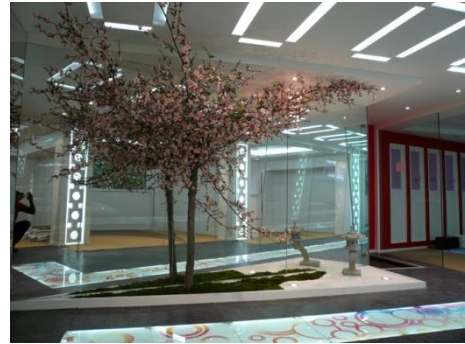
Cerasier reconstitué. Tronc et branches bois, fleurs artificielles. Envergure 5 mètres, hauteur 2,5 mètres.

Le « 100% fait main » prend son sens avec les arbres et arbustes semi-naturels qui sont créés et dimensionnés à la demande. A partir d'un tronc naturel, le squelette, la ramure, sont reconstruits pour s'adapter au lieu.