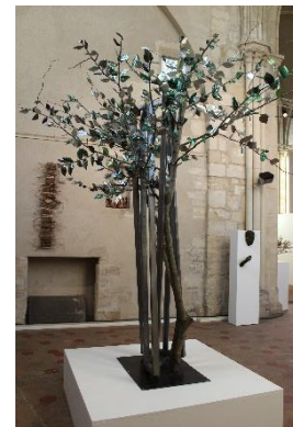
Recycl'Arbre 2 Création pour l'exposition « Les Arborés » à la Commanderie Saint Jean de Corbeil-Essonnes

Improbable pied de nez que nous fait cet arbre : de nos déchets rejetés sans mesure et éparpillés sur le sol, comme les graines d'un fruit nouveau inventé par notre société polluée, renaît une nouvelle génération végétale. Et si le recyclage était porteur d'espoir ?